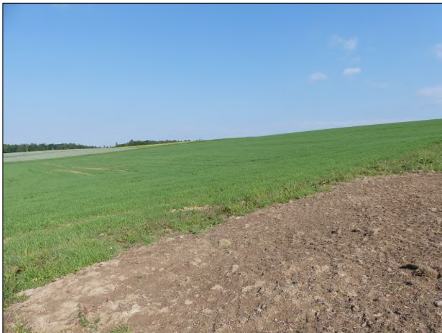
Abb. 4: Östliche Teilfläche des Untersuchungsgebietes, Blick nach Westen, 15.5.2020