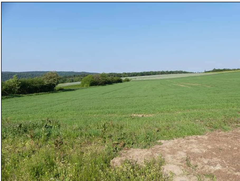
Abb. 4: Heckenstreifen im Süden des Geltungsbereiches, Blick nach Westen, 15.05.2020