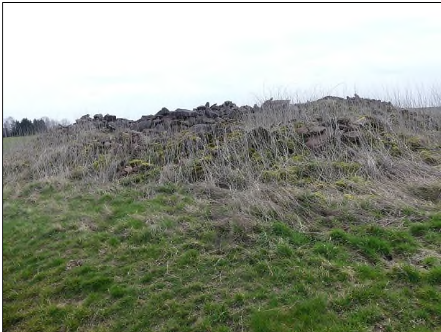
Abb. 4: Lesesteinhaufen im Nordwesten des Geltungsbereiches, 17.3.2020