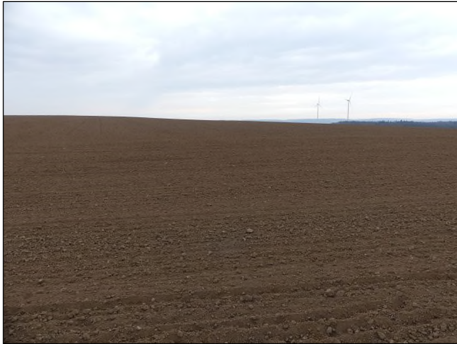
Abb. 3: Zentraler Teil des Geltungsbereichs, Blick nach Osten, 3.4.2020