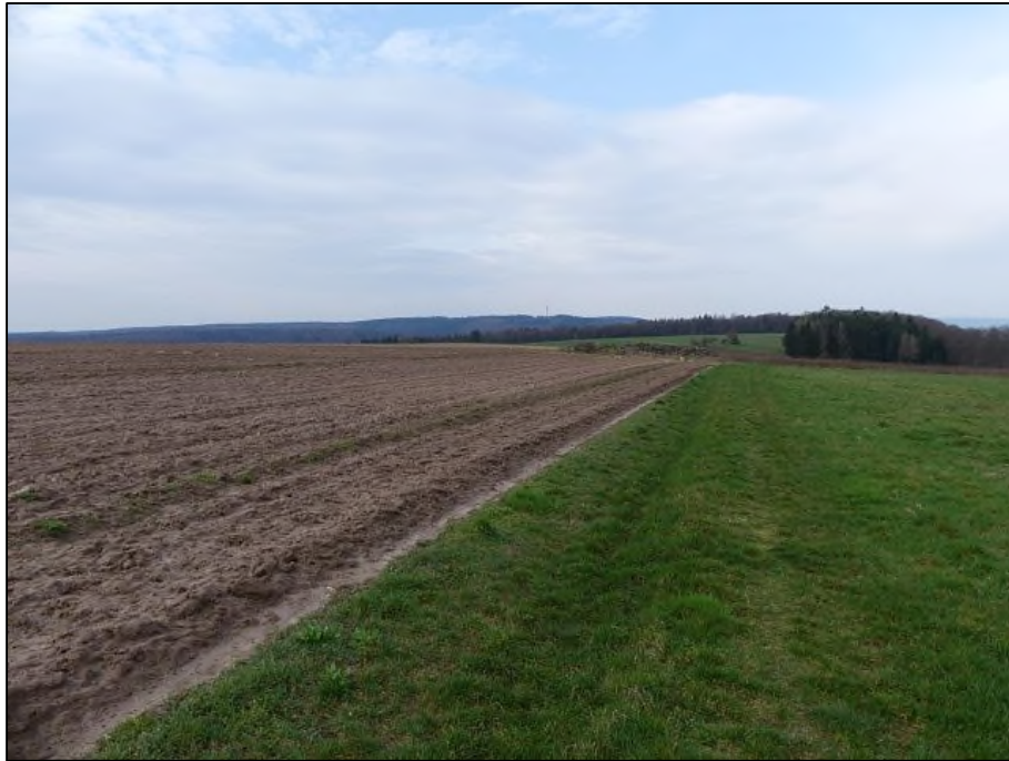
Abb. 3: Nördlicher Teil des Geltungsbereichs, Blick nach Westen, 17.3.2020