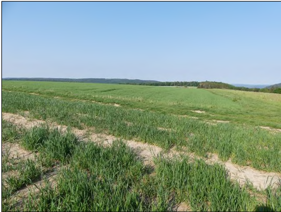
Abb. 3: Nördlicher Teil des geltungsbereichs, Blick nach Westen, 15.5.2020